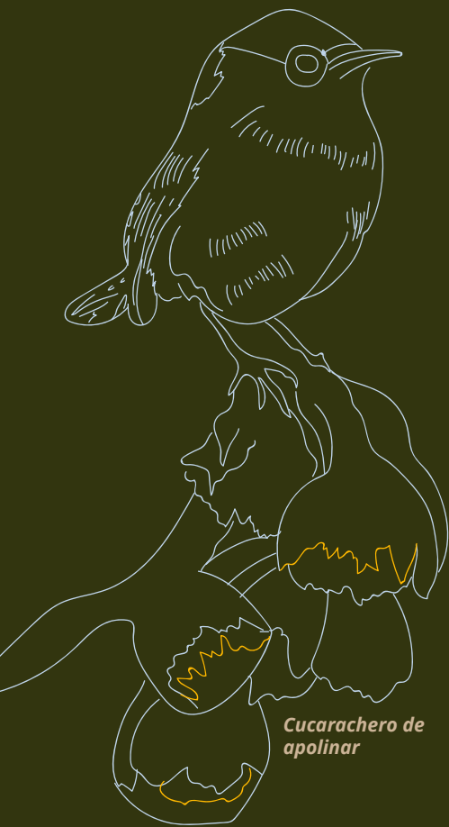
Cucarachero de apolinar

García, Rolando. Sistemas Complejos: Conceptos, Métodos y Fundamentación Epistemológica de La Investigación Interdisciplinaria. (Filosofía de La Ciencia. Gedisa, S.A.: Serie CLA-DE-MA. Gedisa, 2006).