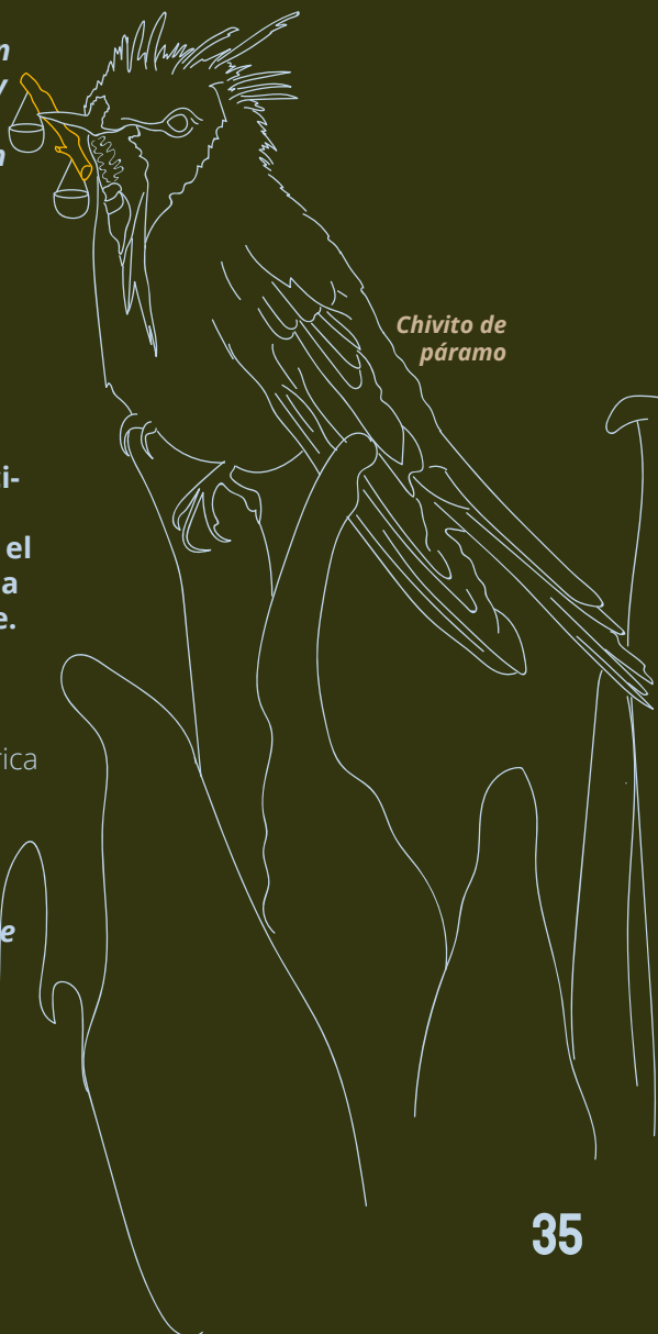
Chivito de páramo